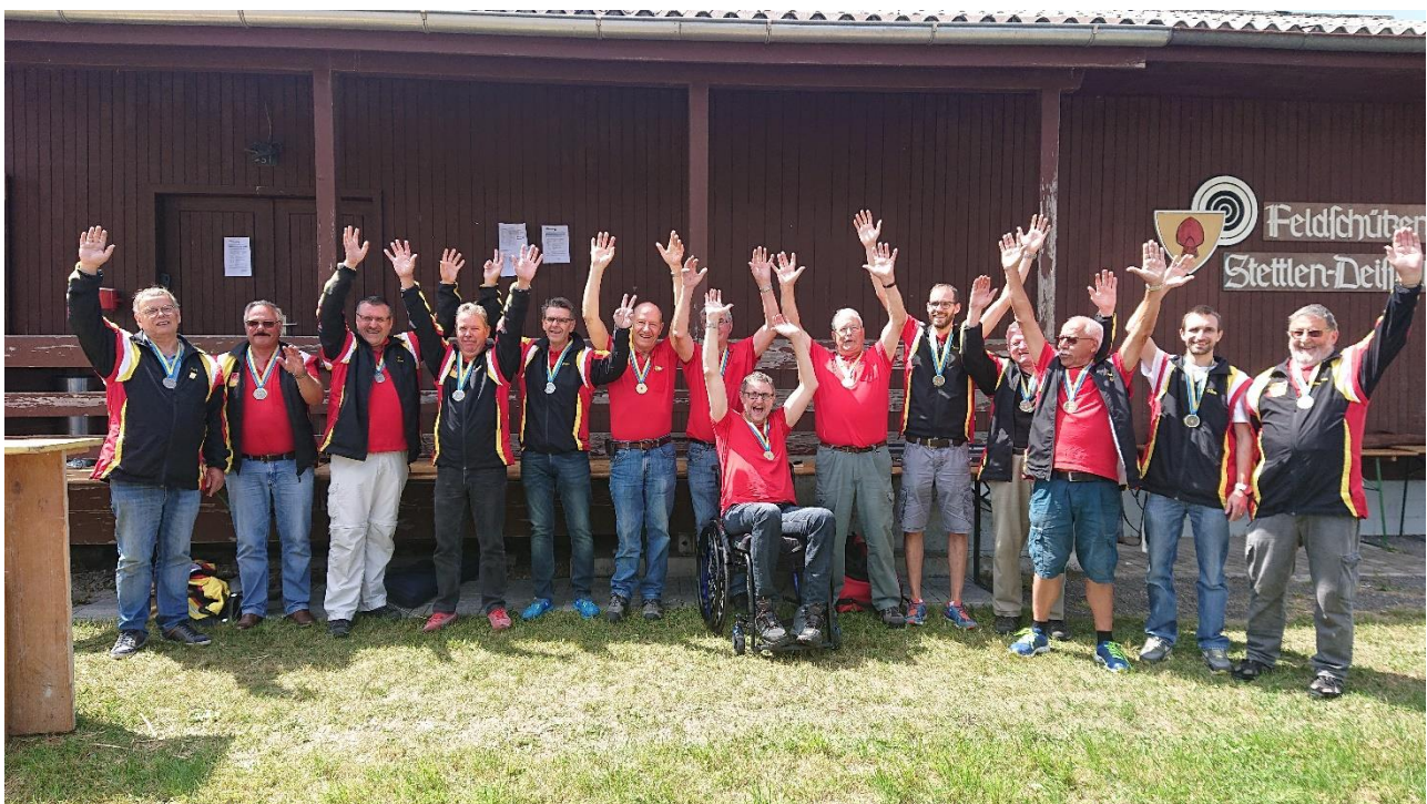
Amtscup Final 2019, die Sportschützen Wolfacker 1.Rang, 2.Rang und 3.Rang in der Kat. Ordonnanz