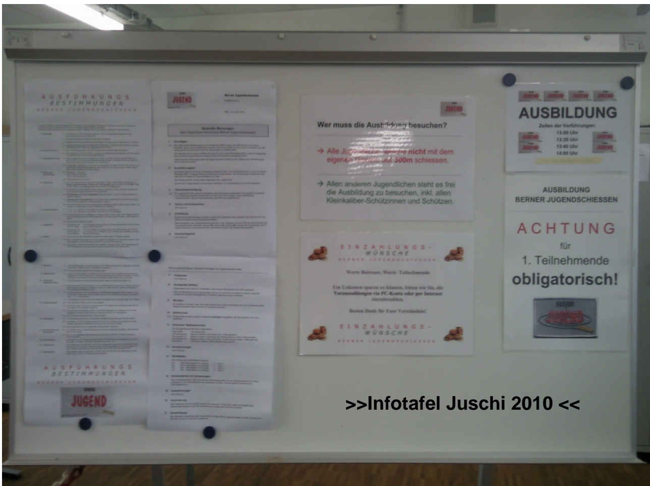
>>Infotafel Juschi 2010 <<

An der Kurzausbildungs-Theorie nahmen insgesamt 48 Jugendliche teil. Davon haben 35 schon mindestens einmal mit dem Sturmgewehr 90 und 29 bereits einmal mit dem Kleinkalibergewehr geschossen. Die Statistik zeigt klar auf, dass die meisten Jugendlichen via Schützenvereine (Kurse) und Familienangehörige auf das Berner Jugendschiessen aufmerksam gemacht wurden. Mund zu Mund Propaganda ist die beste Werbung!